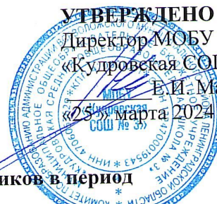
График сдачи школьных учебников в период с 20 по 24 мая 2024 года МОБУ «Кудровская СОШ № 3»

Учебники сдают классные руководители за весь класс.